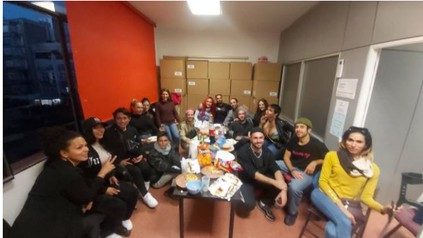
Merienda de Otoño'22