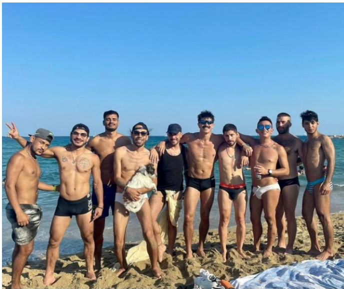
Foto del encuentro PutiverANO

Este año han pasado por estos encuentros unas 30 personas (hombres cis, trans y NB)